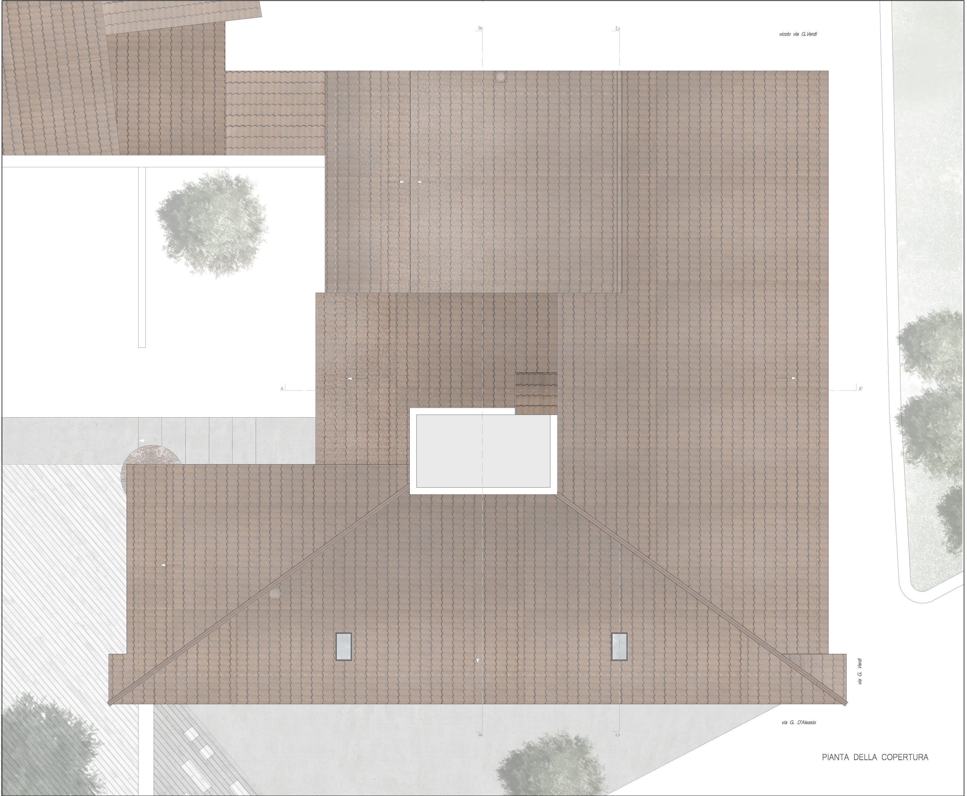
PIANTA DELLA COPERTURA